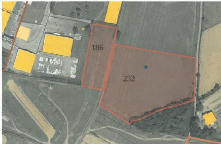
En rouge les parcelles ZA 186 et 232

Chemin de Ferrières, sur la commune de Bernay (27). Dans une zone d'activités. Un terrain nu et libre de 42 544 m 2 cadastré ZA 186 (9 012 m 2 ) et ZA 232 (33 532 m 2 ).